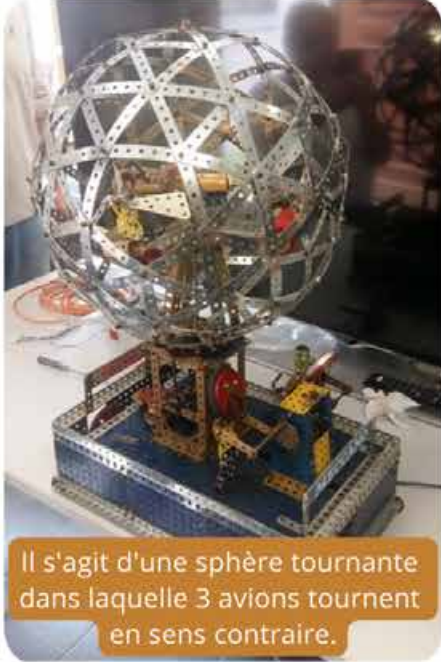
Il s'agit d'une sphère tournante dans laquelle 3 avions tournent en sens contraire.